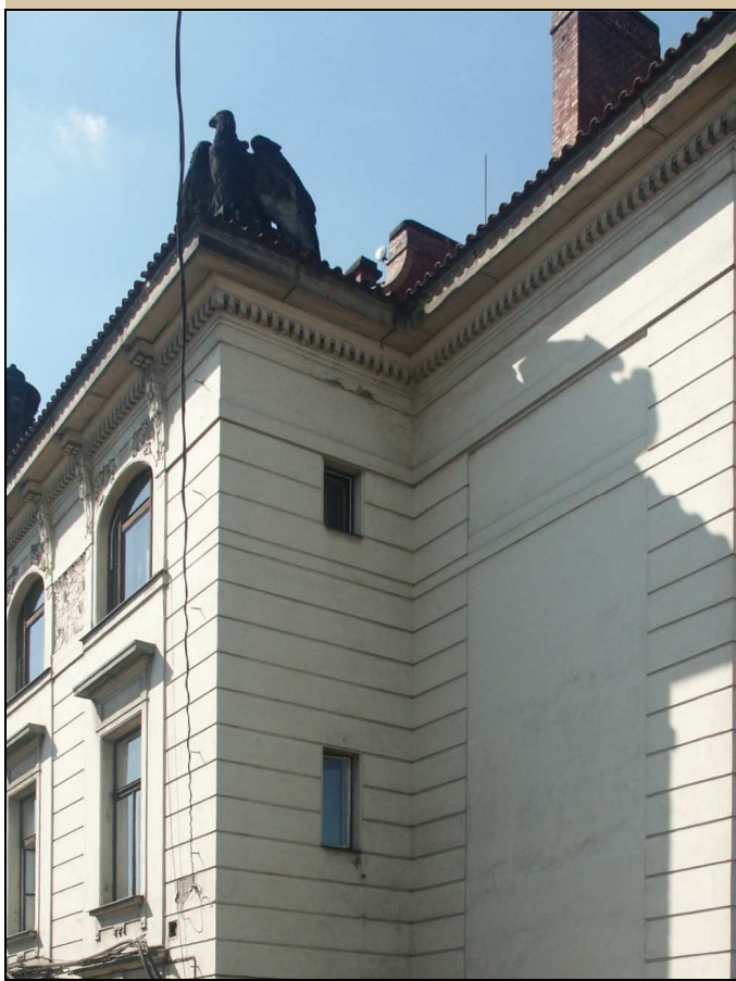
okno – celkový pohled z exteriéru