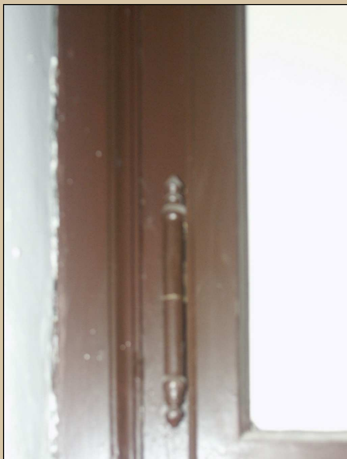
původní zapuštěný okenní závěs